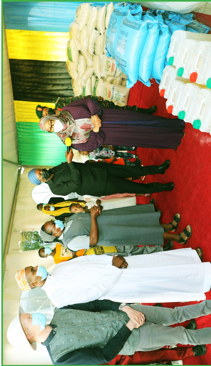
Mheshimiwa Samia Suluhu Hassan, Rais wa Jamhuri ya Muungano wa Tanzania akitoa msaada wa vyakula ikiwemo mchele, majuta ya kupikia, sukari na mbuzi kwa ajili ya kusherehekea sikukuu ya Eid El-fitr kwa vikundi mbalimbali vya watoto wanaoishi katika mazingira magumu, mwezi Mei 2022 Ikulu Chamwino, Jijini Dodoma.