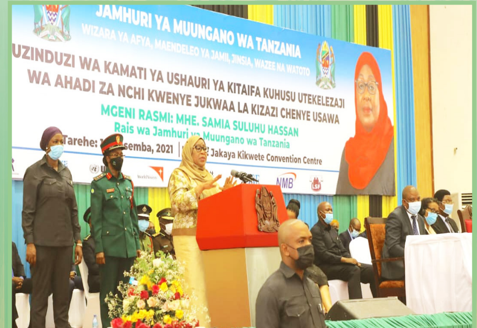
Mheshimiwa Samia Suluhu Hassan, Rais wa Jamhuri ya Muungano wa Tanzania akizungumza wakati wa uzinduzi wa Kamati ya Ushauri ya Kitaifa ya Utekelezaji wa Ahadi za Nchi kuhusu Jukwaa la Kizazi Chenye Usawa tarehe 16 Desemba, 2021 Jijini Dodoma.