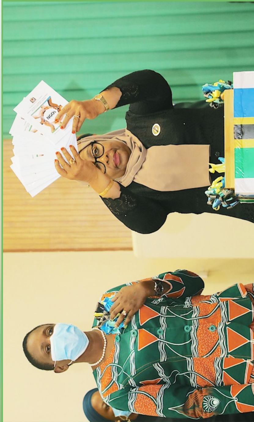
Mheshimiwa Samia Suluhu Hassan, Rais wa Jamhuri ya Muungano wa Tanzania akionesha vitabu baada ya kuzindua Taarifa ya Mchango wa Mashtirika Yasiyo ya Kiserikali wakati wa Mkutano Mkuu wa mwaka wa NGOs tarehe 30 Septemba, 2021 Jijini Dodoma